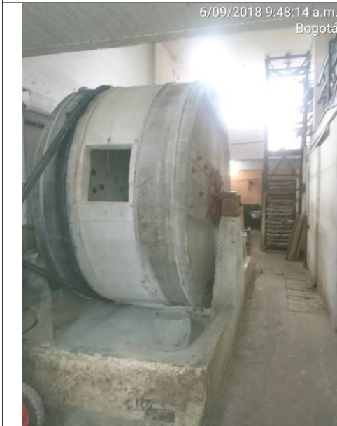
Foto No. 3. Bombos de proceso húmedo.