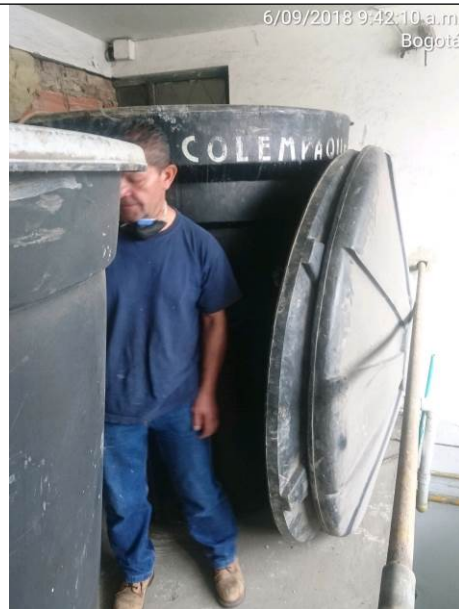
Foto No. 4. Sistema de tratamiento de ARnD.

LA ACTIVIDAD REALIZADA POR EL USUARIO ES GENERADORAS DE ARnD..... SI NO CUERPO RECEPTOR DE LAS AGUAS RESIDUALES NO DOMÉSTICAS