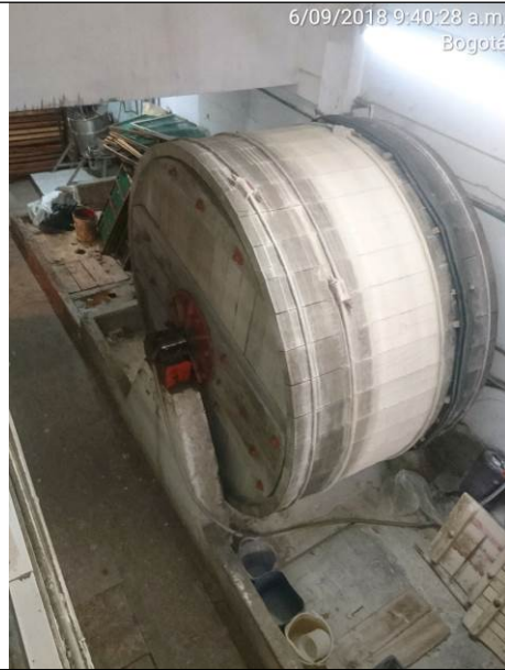
Foto No. 2 Bombos de proceso húmedo.